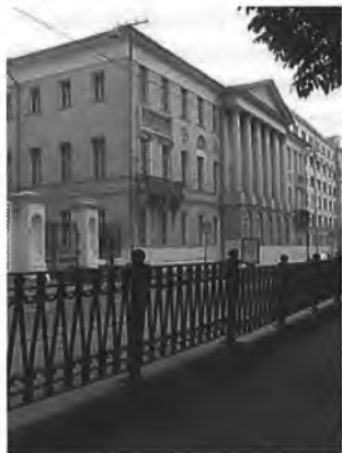
В здании на Покровском бульваре размещалась Академия в 1932—2006 гг.