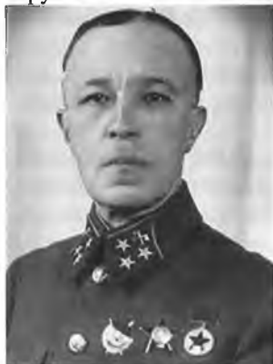
Д. М. Карбышев