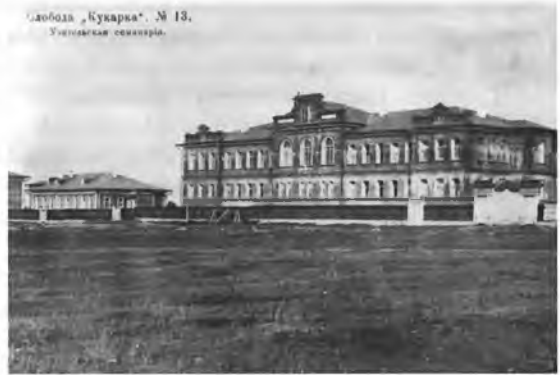
Кукарская учительская семинария