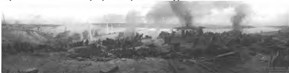
Диорама "Битва за Днепр в районе Переяслава и создание Букринского

23 сентября в район букринской излучины подошли 20-й и 134-й понтонно-мостовые батальоны с тяжелыми переправочными парками. С этого дня началась переправа танков и тяжелой артиллерии через Днепр, которая в последующие дни непрерывно расширялась в связи с подвозом резервных переправочных средств и понтонно-мостовых частей. К концу сентября через Днепр были переправлены главные силы армий. В начале октября инженерные войска создали на Днепре разветвленную и трудноуязвимую систему десантных, паромных и мостовых переправ под различные грузы.