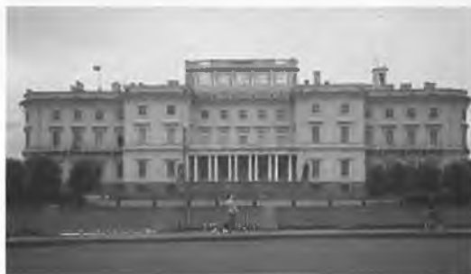
Санкт-Петербургский Военный инженерно-технический университет расположен в районе своего исторического основания вблизи Инженерного замка

В 1927 году в городе Новосибирске он успешно сдает экзамены в Ленинградскую военно-техническую академию РККА на фортификационно-строительный факультет. Именно тогда всего себя он отдал познанию глубин военно-инженерного дела.